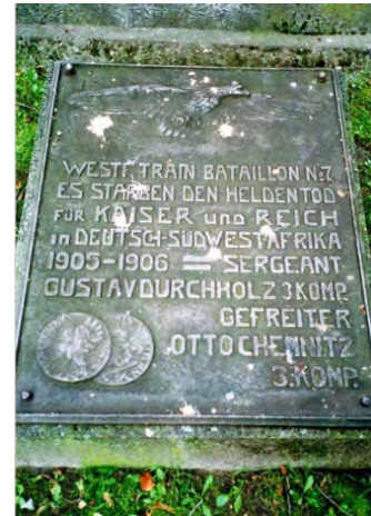
ミュンスターの Traindenkmal（プロイセン 王国軍のヴェストファーレン 第7輸送部隊の戦没者 顕彰碑）の銘板 （Wikimedia Commons）

こうした動きを背景として、旧植民地への文化財返還もドイツでは大きな流れになりつつある 30 。Black Lives Matter（BLM）の運動が出てきて以来、奴隷貿易と植民地主義というアフリカと欧米の関係史を抜きにして歴史を語ることは難しくなっていることがよく分かる。植民地の過去の問い直しは、片方でナチズムの想起と競合しつつ、もう片方で、ドイツ国内にあまた存在する第一次世界大戦以前に植民地に駐屯した部隊に由来する通りの名称の変更や、当該部隊の顕彰碑の撤去といった議論に発展し、従来、ナチ時代に向けられてきた自省的な過去の問い直しは、植民地主義の時代にまでその対象を拡大する様相を見せている 31 。植民地支配に関与したのが