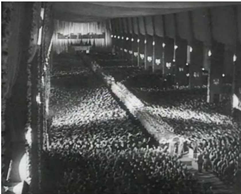
映画『意志の勝利』(1934年)より(1時間31分50秒経過後) 19

そのようなヘッケも、禁止されているナチ的表現を故意に使用したとして2023年6月に起訴された。その対象となったのは、2021年5月29日にザクセン・アンハルト州のメルゼブルクで行った演説の終盤でヘッケが、「心の底から確信して私は言う。われわれの故郷のためにすべてを、ザクセン・アンハルト州のためにすべてを、ドイツのためにすべてを。」ということばを発したことである。一見何でもないように見えるこの「ドイツのためにすべてを」(Alles für Deutschland)は、SA(突撃隊)のスローガンであった。例えばナチのプロパガンダ映画『意志の勝利』( Triumph des Willens , 1934年)の最後のシーンで、党大会を終えるための会場であるルイトポルト・ホールの正面にAlles für Deutschlandという大きな文字が書かれている(下の写真参照)。