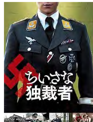
『ちいさな独裁者』(2018) (販売元: アルパトロス)

戦争末期、戦闘を恐れ自分の部隊から脱走したドイツ兵が、ドイツ空軍大尉の軍服一式を見つけ、軽い気持ちで着てみたところ将校と間違えられ、そのまま成りすますという物語です。この主人公がまったくどこも共感できない小狡い人間で、人も容赦なく殺し、囚人たちの処刑にも加わる。「ふつうの一兵卒」だったはずの男が権力を得て好き放題に横暴に振る舞う、「ふつう」とは何だったのかを根幹から揺るがす優れた作品でした。エンドロールが現代に繋がっている演出は見事で、この作品がそもそも突拍子もないアイデアではなく、本当に実在したこともまた、リアルな「ふつうの人」像に拍車をかけます。