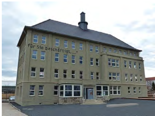
トプフ・ウント・ゼーネ社の資料館

ニエル・ゴールドハーゲン『普通のドイツ人とホロコースト ヒトラーの自発的死刑執行人たち』 7 や、ハンブルク社会研究所の「国防軍の犯罪」展 8 がある。そうした問題意識を受けて、とくに1990年代以降、多くの記念碑