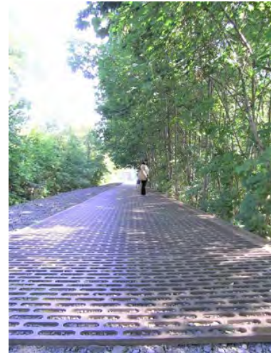
グルーネヴァルト駅（ベルリン）のユダヤ人移送の記念碑。

や資料館が、「ナチではない者たちの対ナチ協力」として括れる文脈で作られていくことになった。ベルリンのグルーネヴァルト駅のドイツ鉄道（Deutsche Bahn）のユダヤ人移送の