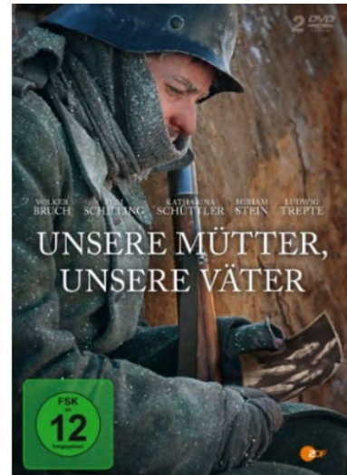
„Unsere Mütter, unsere Väter“ (ドイツ語版 DVD)