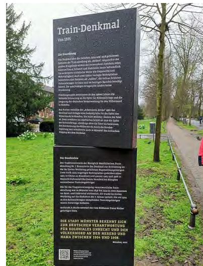
ミュンスターの Traindenkmal に設置された説明板。ドイツの植民地支配について、ドイツ語と英語で説明が付された。

「自省の対象となる過去の拡大」は、共同の想起がグローバルな規模で生じつつあること——すなわち「想起の共同体の地理的な拡大」——に誘発されて生じた現象だといえる。今日、想起の共同体が地理的に拡大するなかで、ドイツの想起の文化に対して、ドイツの外から疑問符が突きつけられているわけである。本章で言及した論争では、「誰が語るのか」という想起の主体が必ずしも明確にされていないことが議論を混乱させているように思われる。ドイツ国内で支配的なナラティヴは、ドイツを超えた広がりをもつナラティヴと異なる性質をもつことがあってよいのか、あるべきでないのか。これは、われわれは歴史をめぐるひとつの認識をもつべきなのか、認識には多様性が認められてしかるべきなのかという問いと関連している。同時に、昨今の論争では、ホロコーストと植民地支配下での暴力行為を「比較してよいか／比較すべきか」という倫理に関わる問いと、「比較することに意味はあるか」という歴史学研究的学術的意義に関わる問いが、十分に整理されることなく「比較可能性」という言葉で括られ、議論されているきらいもある。